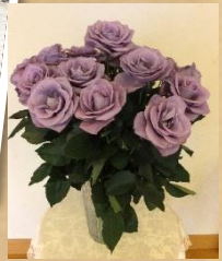
青いバラ「アプローチ」