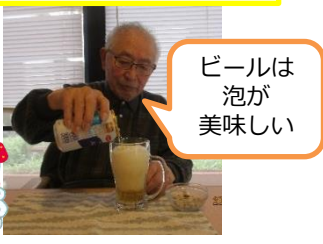
ビールは泡が美味しい