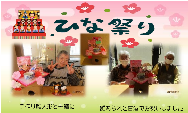
手作り雛人形と一緒に 雛あられと甘酒でお祝いしました