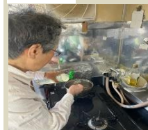
調味料を入れて味付け調整中