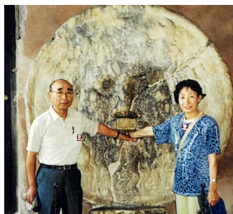
ご主人とイタリアにて

子育てを終えてからは、コーラスに通ったり、市の朗読ボランティアで図書館での読み聞かせテープ録音に忙しくされました。また、学生時代のご友人と旅行を楽しまれたり、お子様の赴任先には国内外問わず必ず行かれ、活動的に過ごされたそうです。