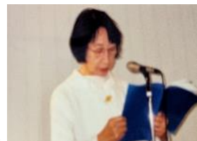
朗読ボランティア活動

勉強を見たり、積極的に映画や絵画鑑賞にも連れて行かれ、良い眼を養うよう時間を割き、育てられました。