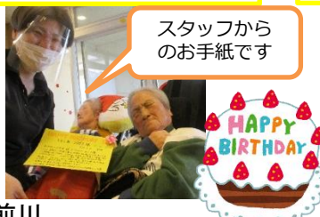
スタッフからのお手紙です